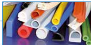
Perfiles de silicona para máquinas de teñido