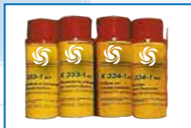
Lubricantes en seco aerosoles 400 ml