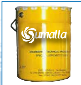
Aceites y grasas lubricantes para todo tipo de maquinaria de alto rendimiento para la industria textil