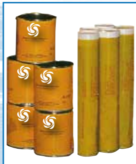
Grasas cartuchos para altas temperaturas, fuertes cargas y extremas presiones de trabajo