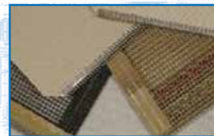
Bandas y Mallas transportadoras de tejido refuerzo de PTFE-Film refuerzo de PTFE-Glas refuerzo de PTFE-Kevlar