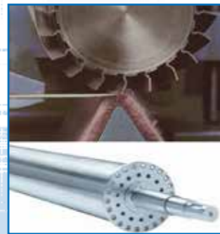
Cilindros, Cuchillas planas y Espirales para Tundosas los cilindros con longitudes de hasta 6.000 mm. y diámetros de corte de hasta 450 mm.