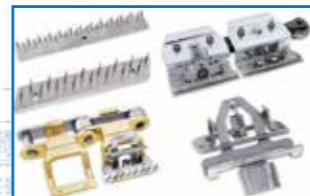
Plaquetas de Agujas, Pinzas y Cadenas para Rame