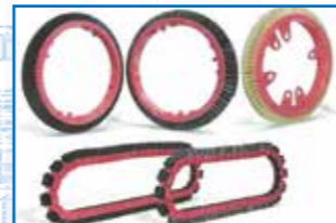
Cepillos Circulares para Rame