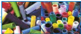
Tubos de plástico para Hilatura texturizado, torsión, bobinado, tintura de hilados sintéticos