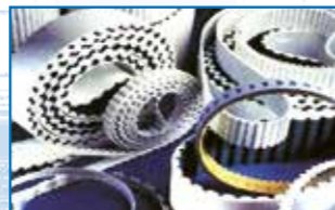
Correas y Bandas correas dentadas correas PV correas trapeciales correas de variador