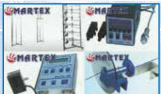
Componentes Auxiliares para máquinas circulares armarios, cestas, aparatos de medición, dispositivos de verificación, accesorios