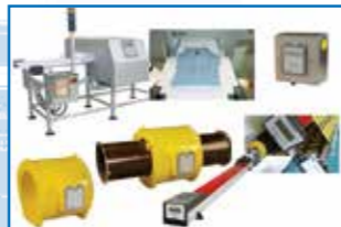
Detectores de metales THS/MN Needle Search TT/HS TE/SLD