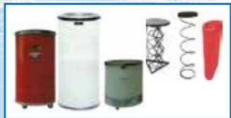
Accesorios para Hilatura frascos de HDPE (polietileno) apartamento pantógrafo hojas de HDPE (polietileno) placa de PP (polipropileno)