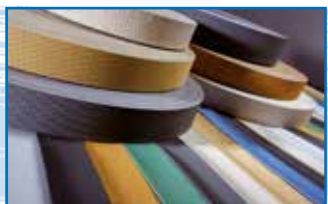
Revestimiento para rodillos de arrastre longitudes: 50'75, 100, 115 m. anchos: 50, 70, 100 mm.