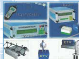
Controladores de Humedad, Temperatura y Aire control de la humedad residual del tejido control de la temperatura del tejido control del aire de descarga