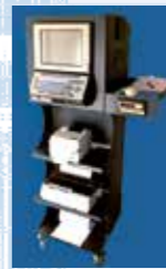
Very-Tex sistema de control de calidad con pantalla táctil y teclado para toma y procesamiento de datos