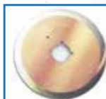
Cuchillas circulares para Rames y Abridoras diam. mm. 200x40x2,5 espesor diam. mm. 300x40x2,5 espesor diam. mm. 250x32x2,5 espesor