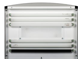
VISTA DE LAS LÁMPARAS